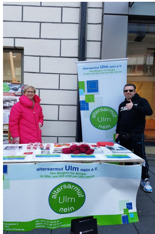
Unser Stand am Equal Pay Day 2022

Zum Equal Pay Day rief das Aktionsbündnis Equal Pay Day (ein Zusammenschluss von Frauenbüro der Stadt Ulm, BPW, Frauenforum und vielen Fraktionen des Ulmer Gemeinderates) alle Frauen in und um Ulm zu einer gemeinsamen Aktion auf.