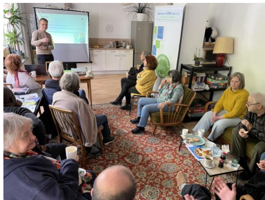
Infoveranstaltung zu Sicherheit in der digitalen Welt.