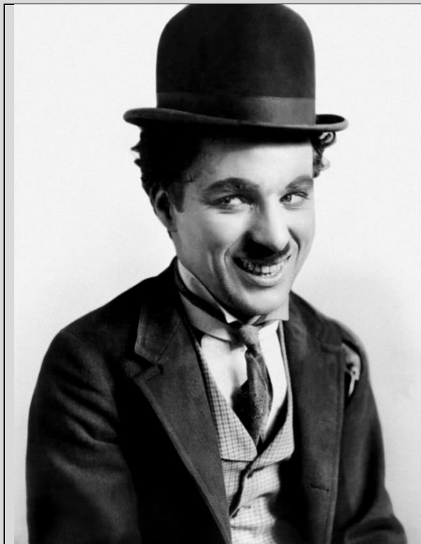
Chaplin in der Rolle des Tramps 1915

Sir Charles Spencer „Charlie“ Chaplin Jr., KBE, (*16. April 1889 in London; † 25. Dezember 1977 in Corsier-sur-Vevey, Schweiz) war ein britischer Komiker, Schauspieler, Regisseur, Drehbuchautor, Filmeditor, Komponist und Filmproduzent. Er gilt als erster Weltstar des Kinos und zählt zu den einflussreichsten Filmmachern der Geschichte.