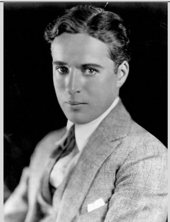
Charlie Chaplin 1920